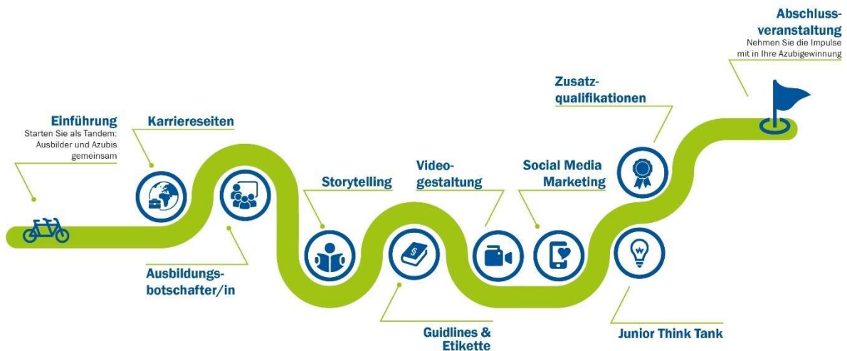
Abbildung 1: Themenübersicht der Seminarreihe